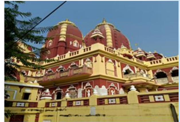
Рисунок 7. Древняя архитектура Индии.