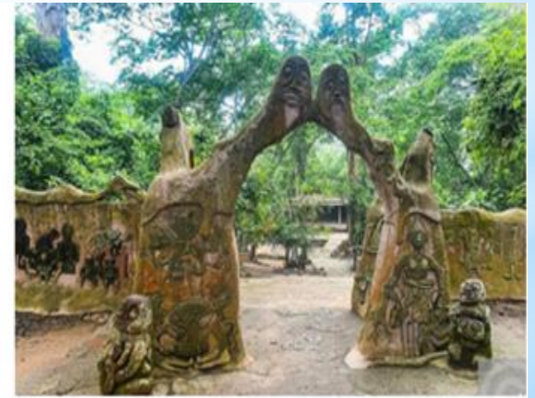
Рисунок 4. Роща Осун-Осогбо, Нигерия