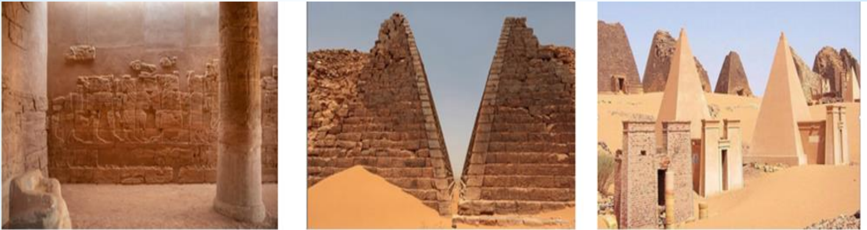
Рисунок 2. Пирамиды Мероэ, Судан

Подобная тема о древних пирамидах была предложена обучающимися из Судана. Состоялась целая дискуссия, в которой было рассказано, что суданским пирамидам Мероэ незаслуженно уделяется меньше внимания как мировому культурному наследию. Презентация включила рассказ о древнем царстве Куш – стране между первым и шестым порогами Нила и далее к югу и востоку по Белому и Голубому Нилу, между Красным морем и Ливийской пустыней, которое существовало в северной части территории современного Судана. Была представлена история возникновения удивительного по своему масштабу пирамидального комплекса (Рисунок 2).