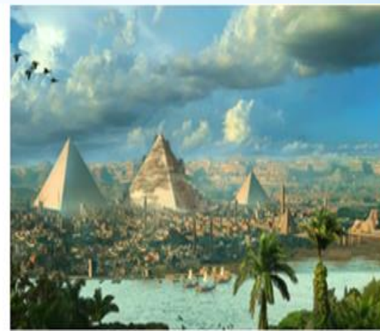
Рисунок 1. Пирамиды Гизы, Египет