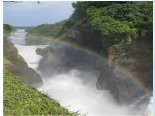
Рисунок 5. Пейзажи Кот-Д’Ивуара