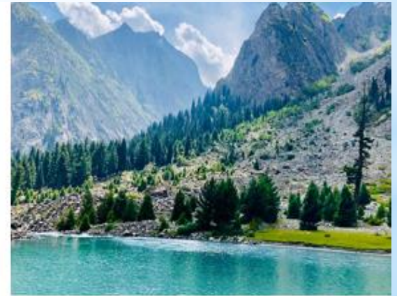
Рисунок 6. Долины и реки Пакистана.